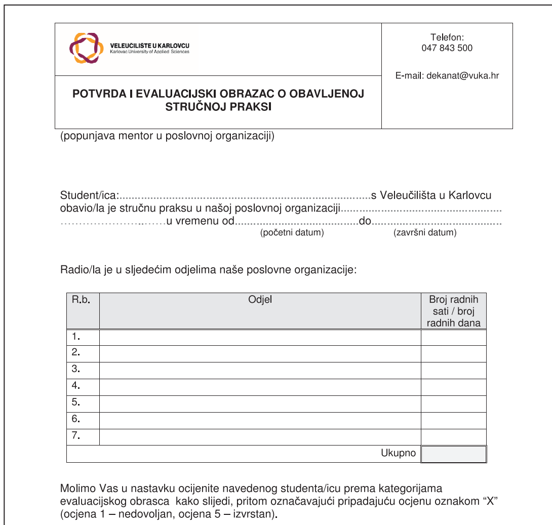
Slika 4: Potvrda o obavljenoj stručnoj praksi

Po obavljenoj stručnoj praksi mentor potpisuje Potvrdu o obavljanju stručne prakse i evaluacijski obrazac. Potvrdu o obavljenoj stručnoj praksi zajedno s Evaluacijskim obrascem o obavljenoj stručnoj praksi (ovjeren od strane mentora) student dostavlja voditelju stručne prakse. Na slici 4 prikazan je obrazac Potvrde o obavljenoj stručnoj praksi. Evaluacijski obrazac prikazan je ranije na slici 2.