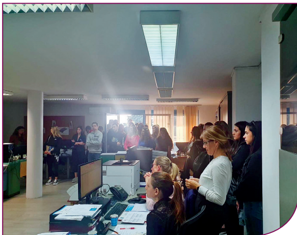
Slika 7: provođenje terenske nastave na studiju Ugostiteljstva

U svrhu unapređenja kvalitete izvedbe predmeta Stručna praksa pri preddiplomskom stručnom studiju Ugostiteljstva te Lovstva i zaštite prirode otvara se prostor za intenziviranje suradnje između voditelja stručne prakse na studiju i mentora poslodavca, kao i njihove kontinuirane i održive edukacije. U okviru projektnih aktivnosti održane su radionice za nastavnike na Veleučilištu i mentore iz poslovnih subjekata u kojima studenti obavljaju stručnu praksu kako bi se poboljšala kvaliteta suradnje mentora te zajednički unaprijedio način obavljanja stručne prakse. Unapređenje kvalitete izvedbe istoimenog predmeta uporišno se manifestira u provedbi ispitivanja stavova poslodavaca anketiranjem i/ili intervjuiranjem o potrebnim kompetencijama, praktičnim vještinama studenata dva-