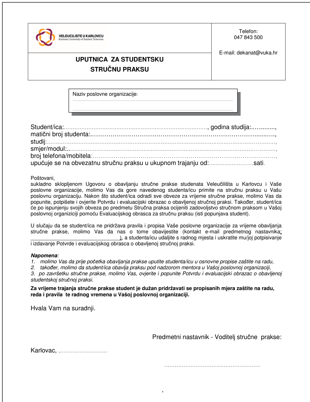
Slika 1: Uputnica za obavljanje stručne prakse (popunjava voditelj stručne prakse)

Slika 1 prikazuje obrazac Uputnice za izvođenje stručne prakse koju popunjava voditelj stručne prakse, a student je donosi u poslovni subjekt prije početka obavljanja stručne prakse.